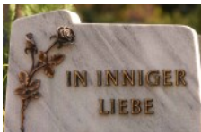
Beerdigungen / Trauerfeiern